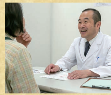
※2018年6月15日 第1回健康フェスタ実施

医師による健康に関するお悩みについて相談会を行います。気になる症状やこれらに向けてどのような準備をすべきかなど、適切にアドバイスします。気軽にお越しください。