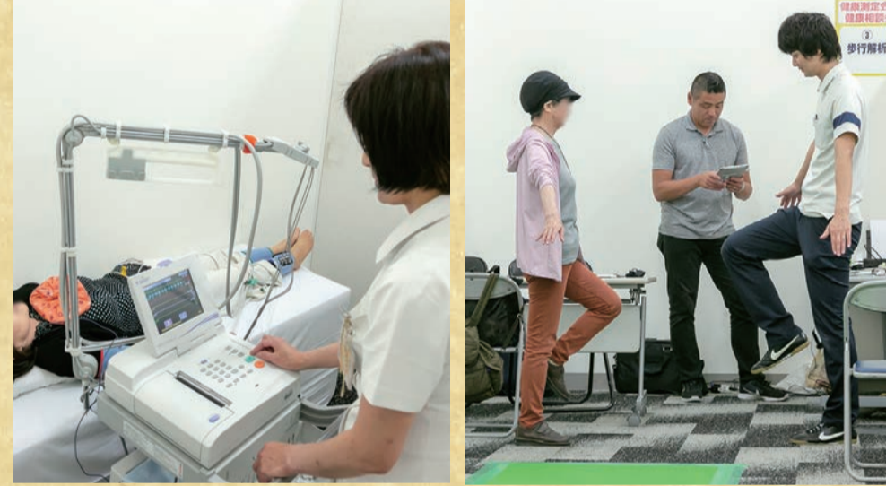
※2018年6月15日 第1回健康フェスタ実施

※詳しくは当日、会場スタッフにお尋ねください。イベントは時間と内容が予告なく変更になる場合がございます。